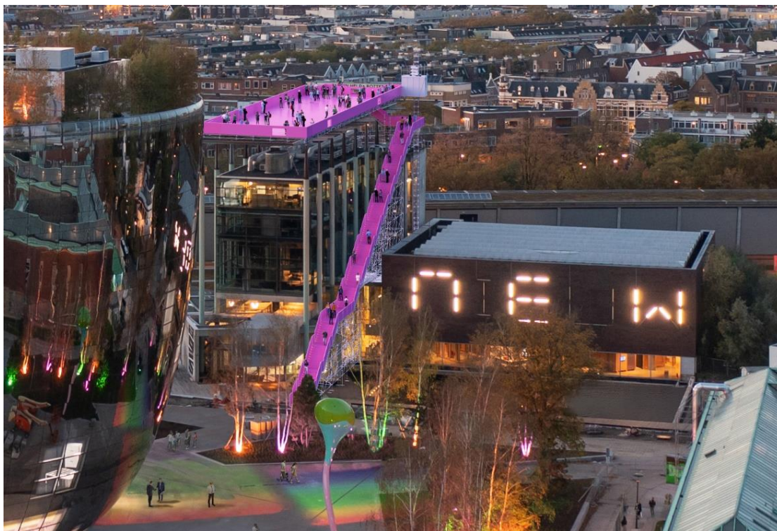
Het Podium op Het Nieuwe Instituut, Festivalhart van de RA Maand 2022, ontworpen door MVRDV. @mvrDV

De organisatie van de Rotterdam Architectuur Maand (RA Maand) nodigt ontwerpers, ontwerpopleidingen en overige partijen die zich betrokken voelen bij de ontwikkeling van het ruimtelijk domein van harte uit om projecten in te zenden voor de hoofdtentoonstelling van de RA Maand 2022. De tentoonstelling is de hele maand juni te zien in Gallery 1 van Het Nieuwe Instituut, Festivalhart van de RA Maand 2022. Projecten kunnen ingediend worden tot en met uiterlijk zondag 27 maart.